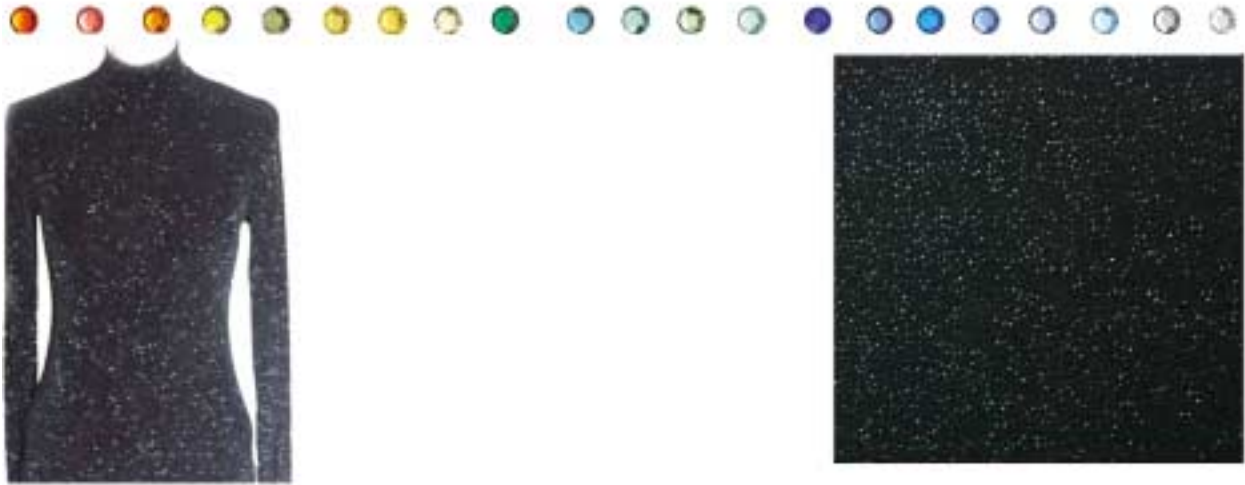
Zwarte glitter slinky stof.