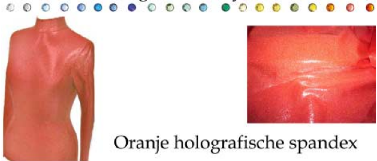
Oranje holografische spandex